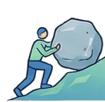
自ら考え行動する