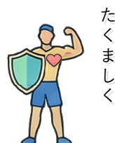
健やかな心身を育む