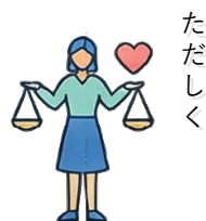
豊かな感性を培う