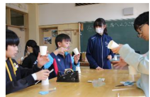
※ 写真は昨年度のもので、今年度は1月31日(土)に実施します。