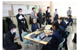
（文責：緑陽中学校 坪田）

小中一貫全体会議の際に両校の研究内容の交流を行っているほか、研究授業の参観等を行い、9年間の学びの中で子ども達の資質・能力の育成に取り組んでいます。