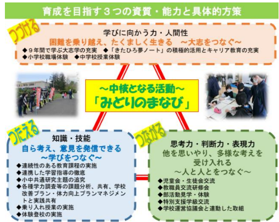
小中一貫教育グランドデザイン（抜粋）

これまでの取組を継続、発展させながら教職員一人一人が共通理解のもと、子ども達の成長を支えていく体制づくりを進めています。今後も小中が一体となり、地域や保護者の皆様と力を合わせて、目指す子ども像を育てていきます。