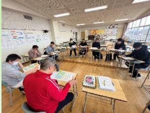
小中一貫会議(年4回)