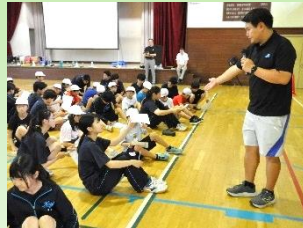
教科部会・小中一貫授業

◆「中学校教諭による小学校乗り入れ授業」「中学校での小中学生による合同授業」「作品等が行き来する連携授業」など、様々な授業形態で実施