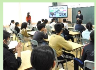
中学校オリエンテーション