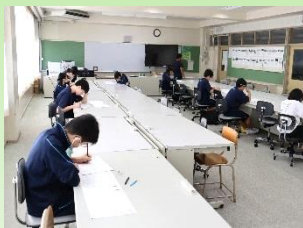
小中合同各種検定受検