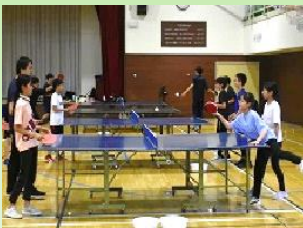
小学生部活動体験