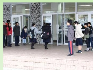
生徒会・児童会合同あいさつ運動