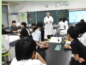
理科・小学校乗り入れ授業