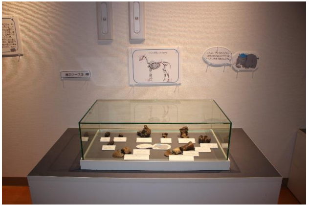
北広島ナウマンゾウ復活プロジェクト！ 関連展示（協力：札幌国際大学）