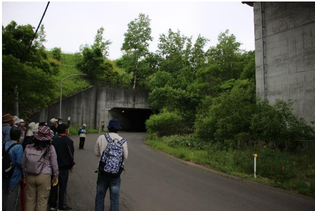
地域遺産発見！発見の小径を歩く（西部地区編）