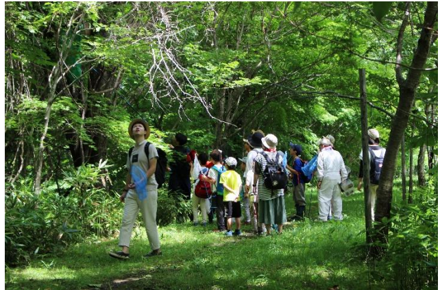
カブトムシ・クワガタムシ採集教室