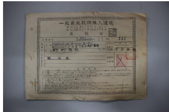
一般用米穀類購入通知