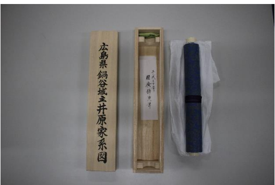
広島県鍋谷城主 井原家系図