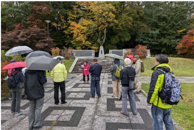
きたひろ140年記念事業 地域遺産発見！発見の小径を歩く（東部地区編）