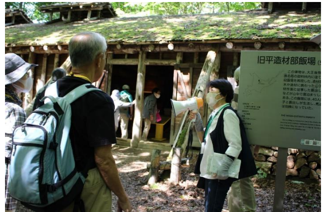
きたひろ140年記念事業 地域遺産発見！バスツアー