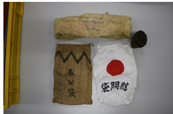
千人針、奉公袋、ゲートル、慰問袋