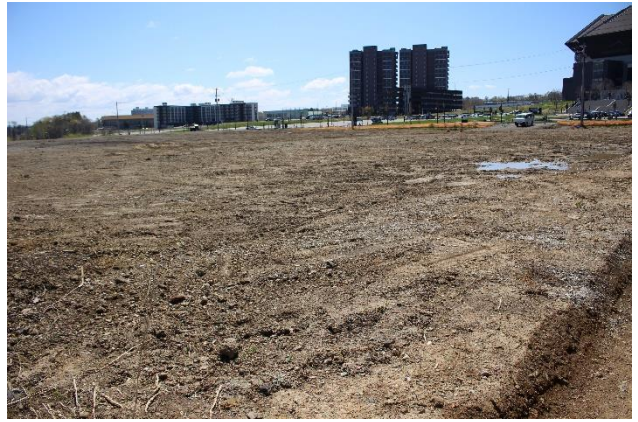
埋蔵文化財所在調査（北広島市共栄179-1外：新駅建設）