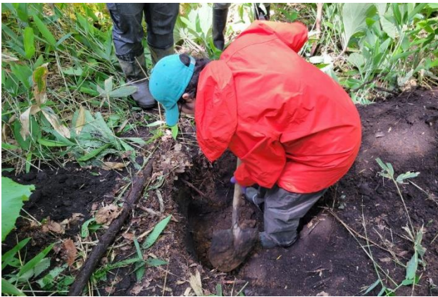
埋蔵文化財所在調査（北広島市輪厚639番ほか）