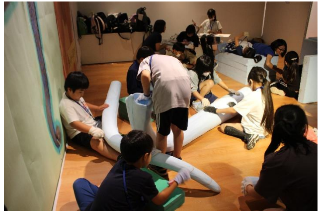
北広島ナウマンゾウ復活プロジェクト！制作風景