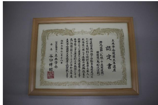
土木学会選奨土木遺産 認定書