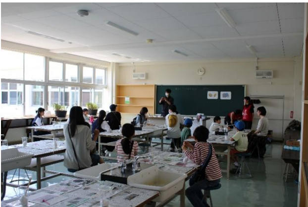
北広島環境ひろば「化石レプリカ製作体験」