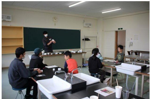
いこ〜よ祭り「貝化石模型づくり体験」