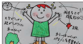
マスコットキャラクター「フウ(楓)」のラフ画

はじめまして。このたび関東から、生まれ育ったまち「きたひろ」に20年ぶりに戻ってきました。特技はイラストを描くことで、5年前に子ども発達支援センターがエルフィンビルに移転した際に、マスコットキャラクターを描かせていただきました(12ページ参照)。オープニングイベントではワークショップを開催し、子どもたちと一緒に作品を作り、思い出深い時間を過ごしました。