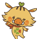
イメージキャラクター 「ウリ丸」