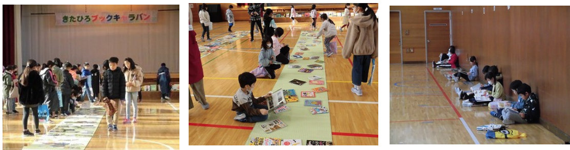
【大曲東小ブックキャラバンの様子】

北広島市図書館のカードで1人3冊を上限として、双葉小688冊、大曲小1,038冊、大曲東小943冊、持ち込んだ全体の約6割、一人あたり2.3冊の貸出がありました。「学校図書館では見られない本が見られた」「おもしろい本がたくさんあった」など、この事業を通じて、子どもたちへの興味関心を高めることができました。次年度以降も希望の学校と時期などを調整しながら開催する予定です。