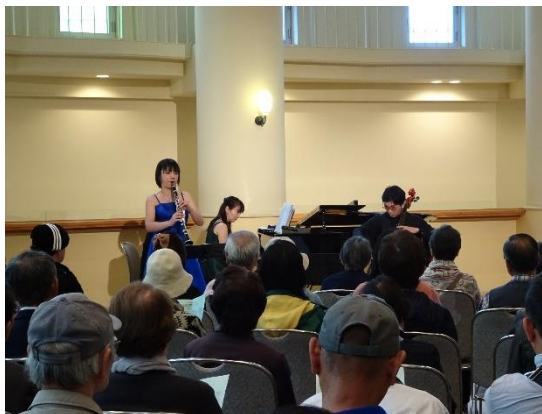
通算 320 回のロビーコンサート 毎月約 100 名が来場