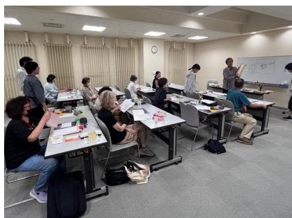
北広島美術協会会員を講師とした水彩画教室