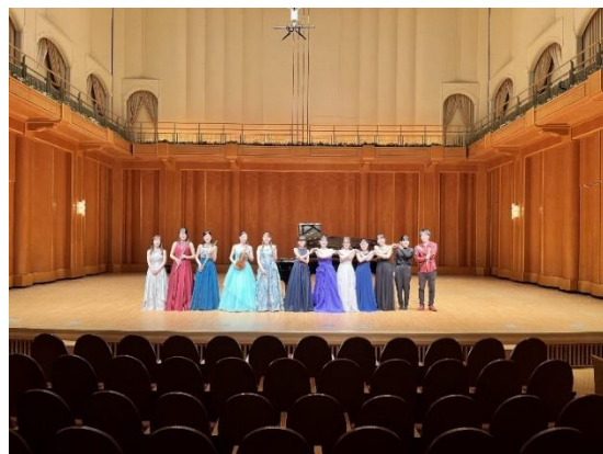
ロビーコンサート出演者による恒例の春の音楽会