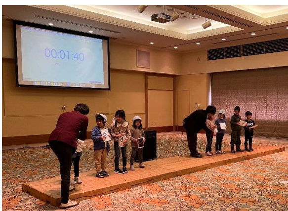
幼稚園・保育園児対象の音楽体験ワークショップ