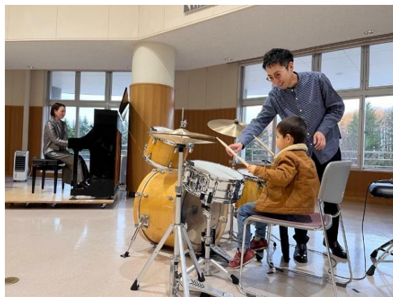
西部地区デリバリーでは楽器演奏体験コーナーも実施