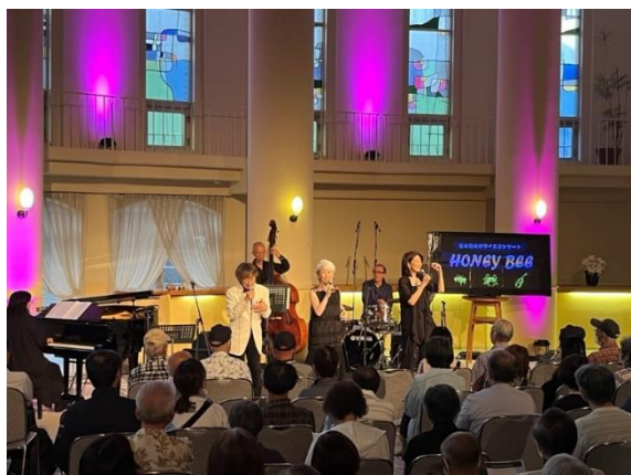
ワンドリンク付きの夏の夜のホワイエコンサート