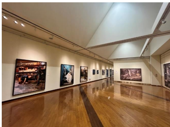
通りすがりに気軽に立ち寄りこともできるギャラリー展