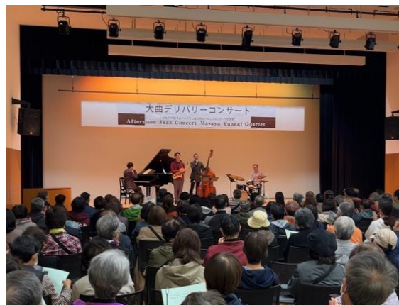
地域に演奏などをお届けするデリバリーコンサート