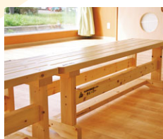
白樺高等養護学校様から 寄贈いただいた木製ベンチ