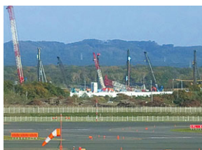
空港から見たラピダス建設現場

A まずはラピダス社の事業計画などについて正確な情報収集を行っていく。その上で本市が持つ立地性を生かした対応について検討を行