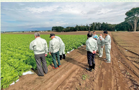
北の里のレタス畑