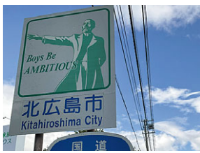
北広島市のカントリーサイン

ページで大いにPRし、また、申し込み方法も電話、メール、市の公式LINEなど、簡単に申し込めるようにするべきでは。