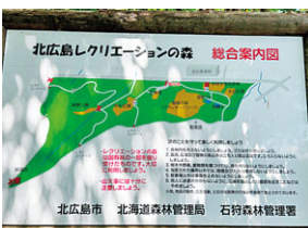
現在、散策路の通行止め箇所が多いレクリエーションの森

A スポーツ推進審議会において必要性の意見がある。リニューールに向けて検討する。