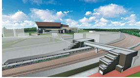
JR新駅のイメージ図

A ポールパークからもたらされる価値と機会によってさまざまな波及効果が本市のめざす都市像に大きく寄与する。ポールパークの構想段階から整備方針を掲げ、魅力あるエリア形成、持続可能な都市経営など、新たなまちづくりにおいて必要な駅である。しかるべき時期に方針をまとめる。