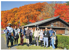
令和3年度の多文化共生推進事業から

Q 多文化共生について 国籍や民族などの異なる人々が、互いの文化的差異を認め合い、対等な関係を築いていこうとしながら、地域社