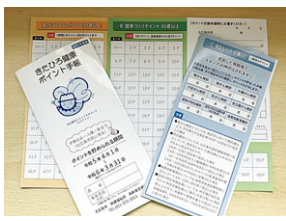
きたひろ健康ポイント手帳