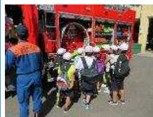
3年生 消防署 市役所・エコミュージアムセンター