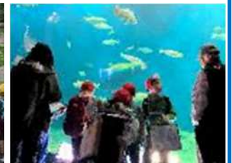
2年生 千歳水族館 市立図書館