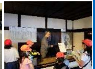
4年生 島松駅通 北海道博物館・開拓の村