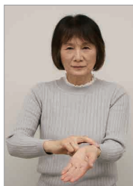
左の手首を右手の人差し指と中指で脈を取るしぐさ