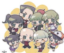
ささえ一家 (地域支え合いセンターマスコット)