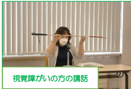
視覚障がいの方の講話