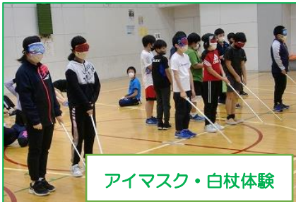
アイマスク・白杖体験