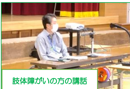
肢体障がいの方の講話