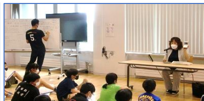
双葉小 8/22 福祉オリエンテーション 8/23,24 車イス体験