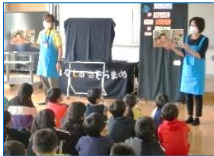
6/28 双葉小 おはなしの会「そらまめ」 4年生への読み聞かせ