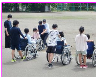
車いす体験 7/21 北の台小