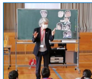
人権教室 7/1 西の里小