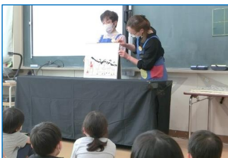
6/21 大曲小 おはなしの会「ぼけと」 1年生への読み聞かせ