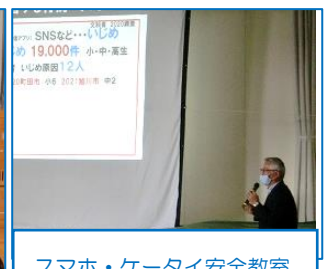
スマホ・ケータイ安全教室