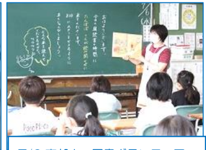
7/6 東部小 図書ボランティア「たんぼぼ」 3・4年生への読み聞かせ