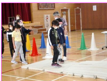
アイマスク体験 6/30 大曲東小