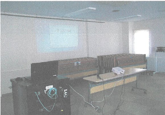
プロジェクターのみのセット↑