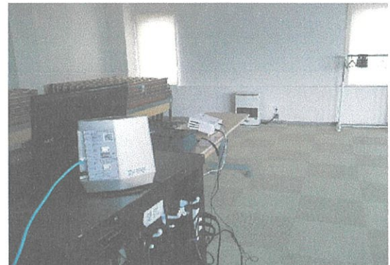
Wi-Fiとプロジェクターのセット↓