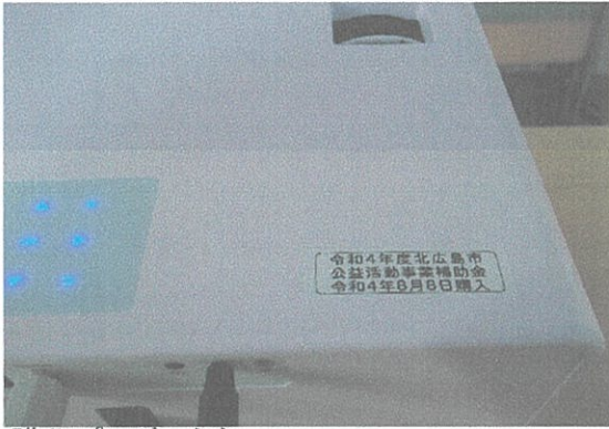
購入プロジェクター