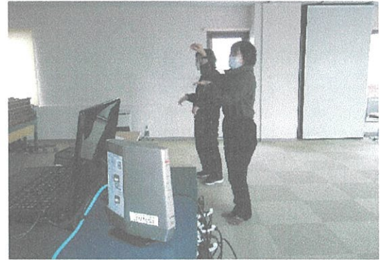
機器を活用しキツネダンス投稿練習 (ストレッチング教室・ベリーエクササイズ)