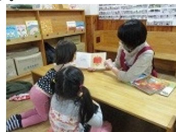
大曲はだかんぼ保育園