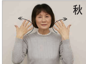
秋 涼しい風が顔の横に来る様子を2回繰り返す