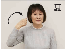
夏 うちわであおいでいる様子