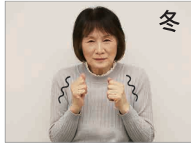
冬 寒くて震えている様子