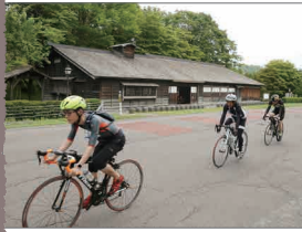
ツール・ド・キタヒロ