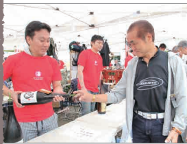
第7回北の酒まつりinきたひろしま *第8回北の酒まつりinきたひろしまについて詳しくは、18ページをご覧ください。