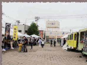
きたひろキッチン

オープンしたため、最初はイベントで使われることが少なかったですが、最近はキッチンカーや移動販売車の出店する日が多くなりました。7月17日・18日には市内の飲食店が集まり、きたひろキッチンが開催されました。雨模様にも関わらずたくさんの人たちが訪れ大盛況でした。他にダンスの発表会やエイサーページェント、中止になったふるさと祭りに変わる夏祭りなども予定されていて、少しずつ活気が出てきました。新型コロナウイルス感染症・熱中症の予防対策をしっかりと、市民交流広場を利用しませんか。