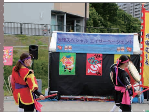
昨年のエイサーページェント

利用期間 5月1日～10月31日 時間 9時～21時 問合せ 総務課 ☎372-3311・内線3313