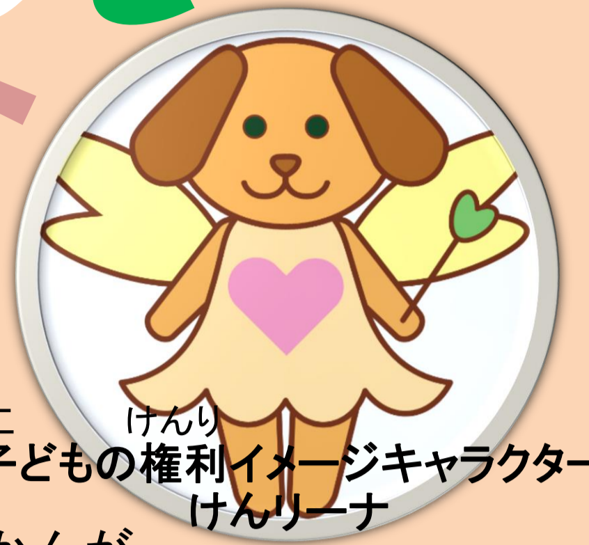
子どもの権利イメージキャラクター けんりーナ