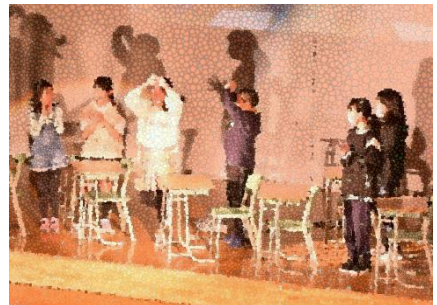
6年生 劇・表現 「SHIN 時代 ～新しい自分に出会う旅～」

子ども達には発表をやり切ったという満足感と、自分や学級が成長したという実感を味わってもらい、残り2か月の2学期を充実させて冬休みへと向かわせたいと考え、職員一同で取り組んでまいります。11月は学校の読書月間（読書週間は10/27～11/9の2週間）、さらに北広島市の小中一貫月間となっており、土曜授業（11/25）の3校時地域公開を予定しております。また、保護者対象の個人懇談も予定しております。引き続き、ご家庭と地域の学校教育に対するご理解とご協力をお願いいたします。