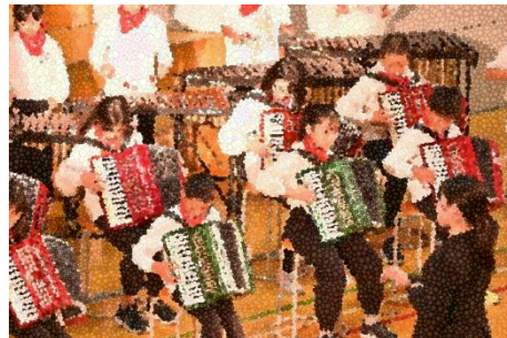
5年生 音楽 「ほくらは明るい音楽隊」