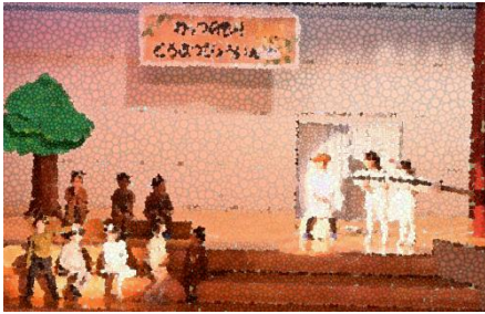
1年生 劇 「わっつのもり どうぶつびょういん」

今回、児童の学芸会実行委員会活動を廃止して、西部CS（コミュニティ・スクール）の運営委員の皆様にお手伝いをさせていただきました。CS委員の皆様には実行委員会を担当していた業務を行っていただくことで、教員は登校から下校まで、児童の指導に専念できました。（昨年までは発表と実行委員会の活動の指導の両方を教員が担っていました）さらに、CS委員の皆様が練習から児童の様子を見て「本番の児童の集中力に驚きました」「児童公開の時よりも地域公開の時に発表がレベルアップしていました」等の感想をいただき、児童の成長の様子をじかに見ていただくことができたことも収穫です。