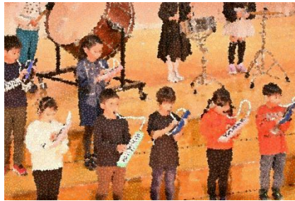
2年生 音楽 「リズムに乗って元気よく!」