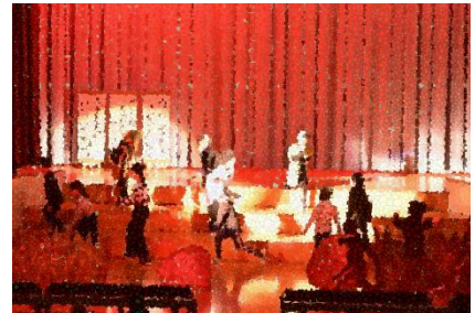
3年生 劇 「どろぼうがっこう」