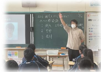
道徳の授業の様子

このようなことを受けて、学校では、道徳の時間に全学級で、「新型コロナウイルス～差別・偏見をなくそう」をテーマに考える機会を設けました。生徒から多くの意見が出され、話し合いを持ち、「病気」「不安」「差別」という3つの感染を防ぐのは私たちの意識と行動であることや、「優しさと思いやりはウイルスとたたかう力になる」ことを学びました。