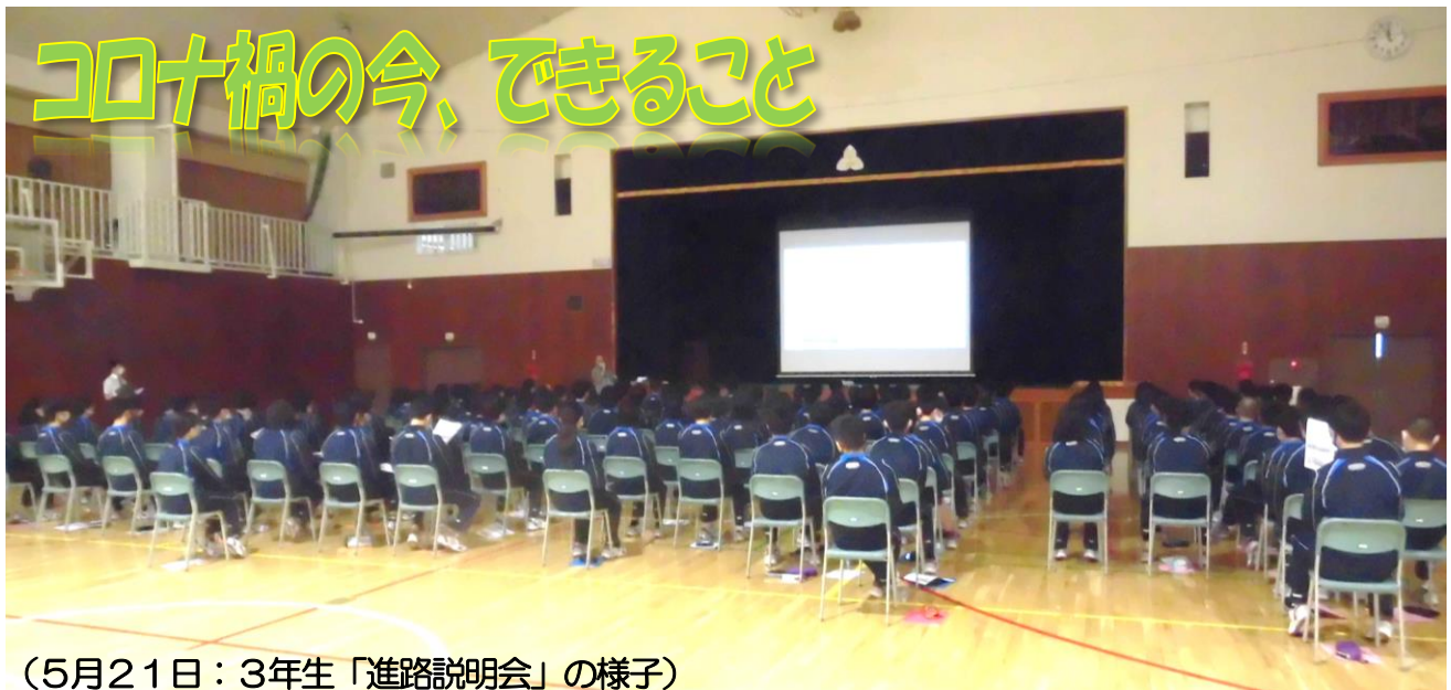
(5月21日：3年生「進路説明会」の様子)

www.school.city.kitahiroshima.hokkaido.jp/oomagarit/