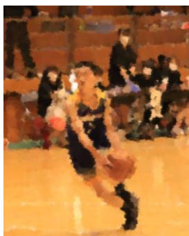
市内中体連大会の様子

後述しているように、団体では男女バスケットボール部、女子ソフトテニス部が優勝するなど団体・個人を含め7つの部が管内出場を決めました。7月9、10日に行われる管内中体連大会では、北広島市の代表として、自分たちの力を全力で出し切ることを期待しています。