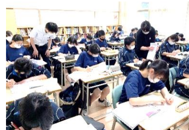
放課後学習会の様子

また、残念ながら、管内出場が叶わなかった部活動、生徒の皆さんは、今大会を振り返り反省し、次の大会に繋げてほしいと思います。この大会で、部活動を引退する3年生もいますが、今までの頑張りを進路に向けた学習や新たな目標に生かしてほしいと思います。