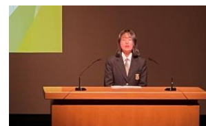
さんの発表の様子

10月26日（火）、石狩管内中学校文化連盟生活体験・英語発表大会が、江別の大麻公民館・えぼあホールで行われ、学校の代表として本校から2名の生徒が参加しました。生活体験発表では、3年4組の さんが『輝く小指』と題して、自分の怪我の体験から人々が安心して暮らすことができる社会の実現を目指そうとする決意が、穏やかな口調で語られました。また、英語暗唱発表では、3年3組の さんがオードリー・ヘップバーンの生涯を、流暢な発音と温かな視線で語られました。2名の生徒とも、表現力豊かに堂々と発表している姿に感動しました。このように、文化活動やスポーツの面でも、10月から11月にかけて生徒の活躍が光りました。