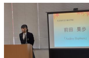
さんの発表の様子

また、今、これから行われる学年別の合唱交流会に向けた歌声が校内に響いています。合唱を通して、クラスや学年の高まりを期待しています。その頑張る姿をご参観いただければ幸いです。