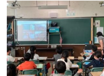
2小学校合同授業 ＜総合的な学習の時間＞ 「ネイチャーチャレンジ！ ～報告会をしよう～」