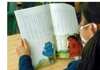
＜小4・中2＞「泣いた赤おに」