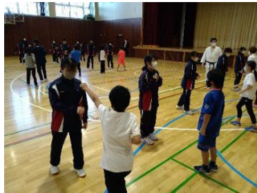
体の動きを高めるための小5・中2合同体育の授業