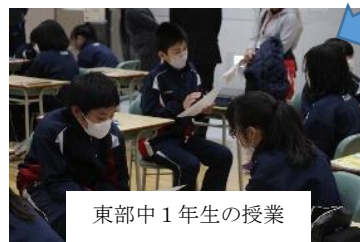
東部中1年生の授業