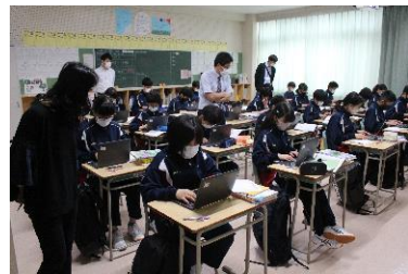
小学校とのつながりを意識させる中1国語の授業

「調査結果分析を生かした授業」 「専門性を生かした授業」 「系統を踏まえた授業」