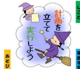
東部中学校地区 小中一貫教育