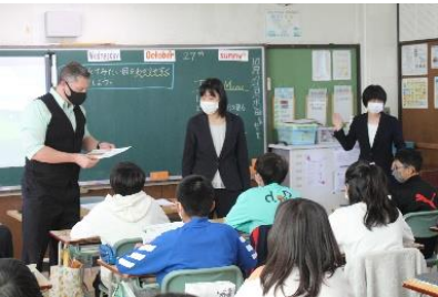
小6担任とALTと中学校の英語教諭による小学校の外国語の授業

「調査結果分析を生かした授業」 「専門性を生かした授業」 「系統を踏まえた授業」