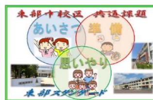
＜東部小・北の台小＞