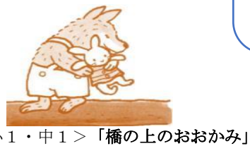
＜小1・中1＞「橋の上のおおかみ」