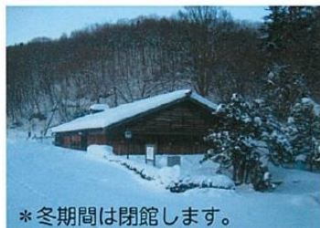
*冬期間は閉館します。