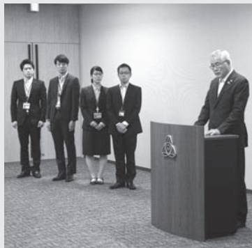
被災した東広島市に派遣された職員 の壮行会（8月31日）