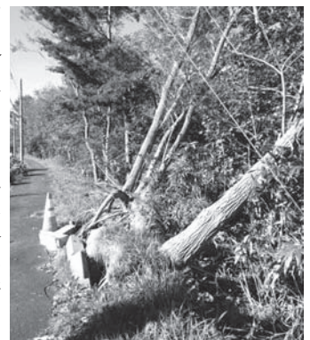
山手町外周の倒木