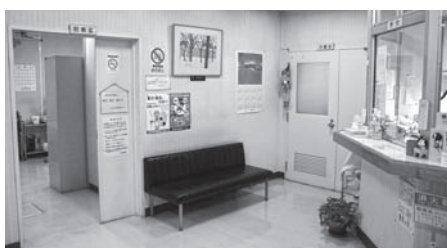
夜間急病センター

・夜間急病センターは、来年6月中旬に移転する予定であり、それまでの間、現施設で対応するため、指定管理者の指定期間を6月末まで延長するものである。