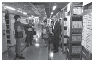
市川市図書館にて

館と学校図書館、さらに学校図書館相互のネットワーク化を図り、学校図書館を中心とした教育機能を高め、児童生徒の自ら学ぶ力などを育み、生涯にわたって学び続ける市民の育成を目指す、学校図書館ネットワーク事業を実施している。