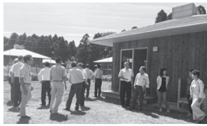
香取市クラインガルデン栗源にて

「道の駅くりもと」を中心とした、総合的な都市農村交流展開のために、千葉県初の滞在型市民農園として平成18年4月に整備された。施設の内容は、共同利用施設1棟、農機具庫棟1棟、30平方メートルのラウベと110平方メートルの畑がついている