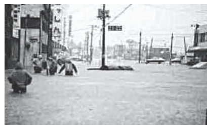
昭和56年の大雨災害(旧広島町市街)

答 本市の避難勧告等の運用においては、各種の情報や、夜間や風雨の中での避難にはより多くの時間を要するなどにも考慮した上で総合的に判断を行って対応している。指摘の内容にも、十分に注意し対応していきたい。