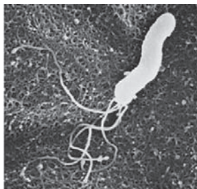
胃がんなどの主な原因となるピロリ菌

問 本年度より、中学3年生を対象に、学校検診の尿検査の中で、ピロリ菌の有無を判定し、陽性の場合、市内の医療機関で検査するピロリ菌の二次検査のクーポン券を配布する事業がスタートした。今年度の中学3年生の尿検査で陽性の生徒はどれくらいか。また、苫小牧市でも実施している、除菌治療に對しての助成も行ってはどうか。