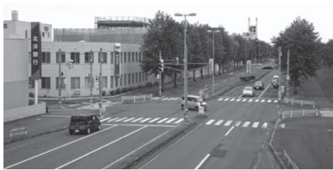
高度化が期待される北広島駅周辺地域

答 北広島駅及び周辺を核として、東部市街地、ボールパーク構想予定地と連担性をもったまちづくりをどのように推進するのか。