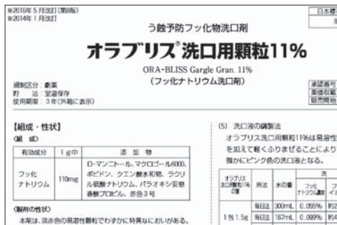
保育園のフッ化物洗口で使用されている薬剤の添付書

なりにくいおやつのお食べ方なども重要。歯科保健指導や栄養指導などの機会を通じ、保護者に対し指導や啓発を行っている。