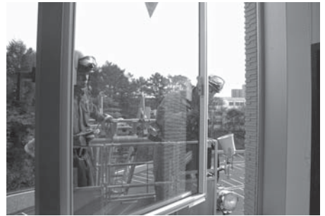
庁舎5階消防隊進入口確認の様子