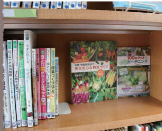
季節に合わせた本を用意