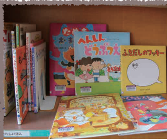
新しく入ってきた絵本

くまさん号が来るのを楽しみに待っている方も多くいます。現在は、市内11カ所を2週間に一度の間隔で運行しています。「少しずつ本を入れ替え、新刊もそろえていますので、利用してくれるとうれしいです」と担当の司書が話してくれました。移動図書館車に積んでいる本の貸出・返却のほか、本の予約などもあるので近くにお住まいの方は、気軽にくまさん号を利用してみませんか。運行状況は、図書館に問い合わせてください。