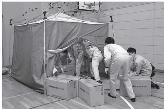
室内用テントに段ボールベッドを搬入