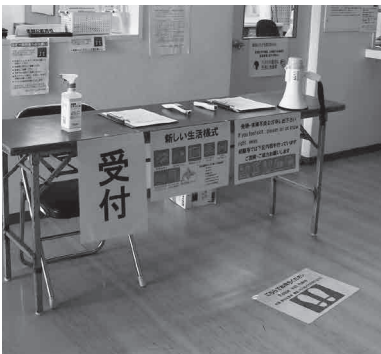
受け付けで検温と消毒