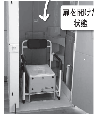
自動ラップ式トイレ