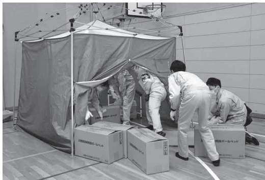
室内用テントに段ボールベッドを搬入