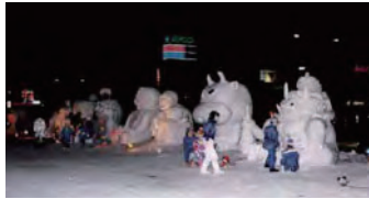
平成9年・手作りの雪像