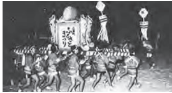
昭和61年・初めての雪まつり