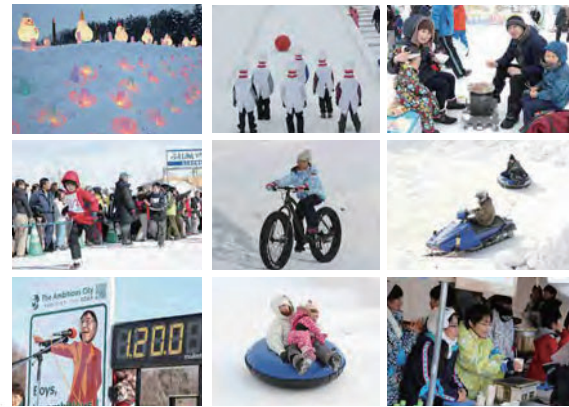
平成20年からの雪まつりの様子

昭和61年から行われてきた「ふれあい雪まつり」。今年も開催予定でしたが、新型コロナウイルス感染症対策のため中止になりました。平成19年までは北広公園横広場（現在の芸術文化ホール臨時駐車場）で行われ、雪像が数台並ぶ手作り感あふれるものでした。20年からは総合体育館横のイベント広場に会場を移し、寒地焼肉まつりや花火大会などたくさんさんの催しも行われるようになりました。来年は楽しい雪まつりが開催されると思います。