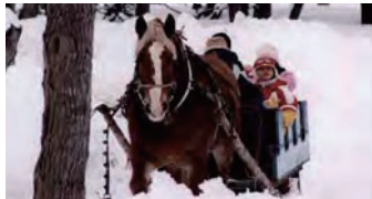
平成17年・シャンシャン馬そり