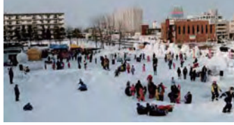
平成8年・雪まつり会場