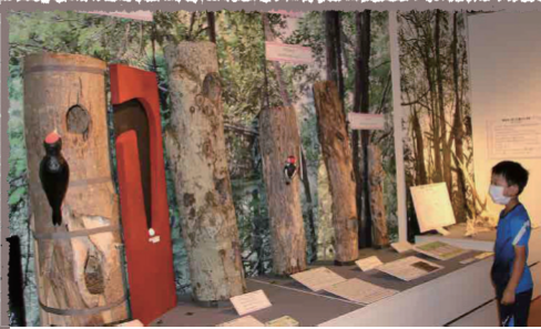
原始林に生息するクマゲラやアカゲラの実物大の模型と、実際に営巣した木

に北海道庁長官に直訴し、願いが受け入れられたそうです。昭和29年に国の特別天然記念物に指定。しかし、同年の洞爺丸台風による倒木などで大部分の指定が解除され、レクリエーションの森に連なる当市の区域だけが残りました。昨年10月、北海道ポールパークFビレッジのアクセス道路予定地に沿った区域が、保護すべき植生であると認められ追加で特別天然記念物に指定されました。