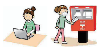
インターネット回答か紙の調査票で郵送提出

*原則はインターネットか郵送での回答ですが、どちらもできない場合は国勢調査北広島市実施本部に連絡してください。直接回収に伺います。