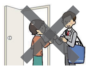
調査員が面会して配布