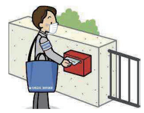
調査員が郵便受けに投函