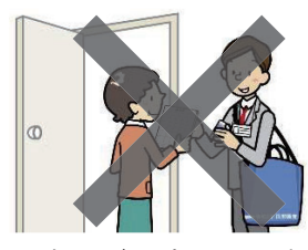
調査員が面会して回収