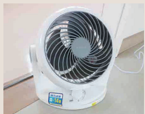
サーキュレーター