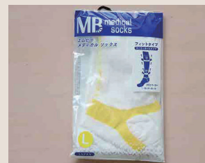
医療用弾性ストッキング