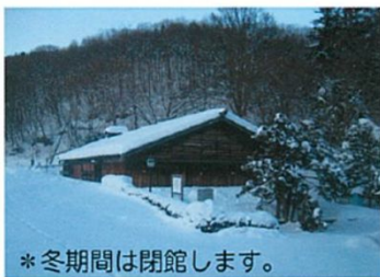
*冬期間は閉館します。