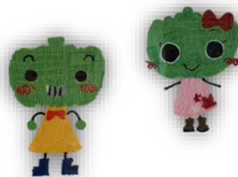
西部中マスコット かほちゃん&ちゃこちゃん

主人公である子どもたちと教職員、そして保護者、地域の皆様が心をつなげた教育活動を進めていければと考えていますので、今年度もどうぞよろしくお願いいたします。