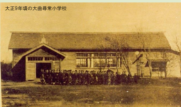
大正9年頃の大曲尋常小学校