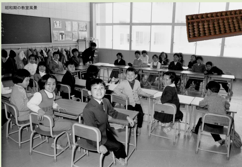
昭和期の教室風景