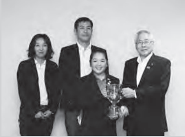
両親と一緒に市役所で世界ジュニアゴルフ選手権優勝を報告