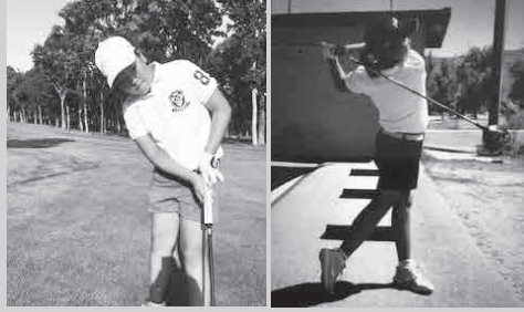
「自分がイメージした通りにショットが決まるとうれしい」とゴルフの楽しさを語る