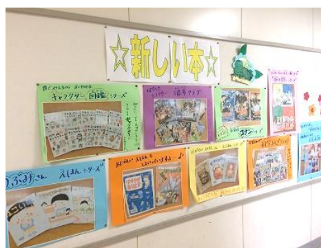
北の台小 図書室前廊下 新刊案内の掲示