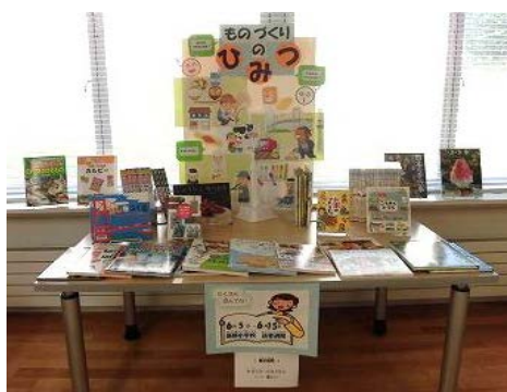
西部小 特集「ものづくりのひみつ」

図書室の環境整備、選書や除籍についてのアドバイス、修理の講習なども行っています。また、北広島市図書館の蔵書のうち、学校図書館において利用が見込まれる図書を図書センターへ移管して、有効に活用しています。