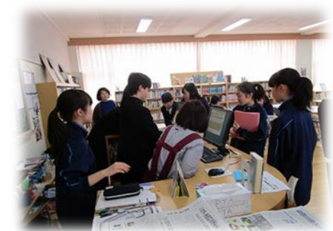
広葉中 図書室利用オリエンテーションの様子