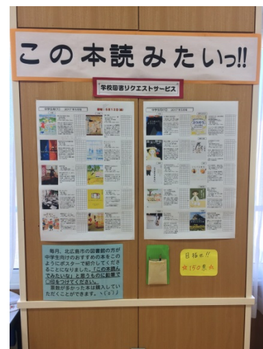
西の里中学校 図書室