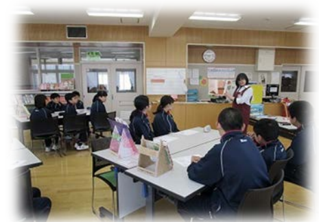
西の里中 図書室利用オリエンテーションの様子

平成 26 年 6 月から、中学校を学校司書 3 名が巡回し、環境整備や資料整備、読書活動の推進等を教諭とともにしています。