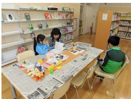
緑ヶ丘小学校図書室 (作業台で折り紙や読書をする児童の様子)