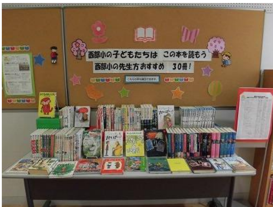
(西部小学校 図書室)