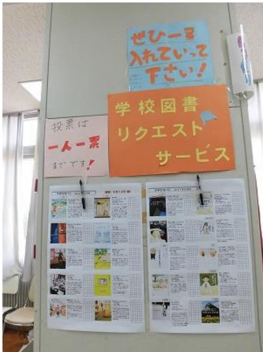
東部中学校図書室 (学校図書リクエストサービス)

また、その他にも読書活動推進に対する事業として、「特集コーナーの設置」や、「新聞コーナーの設置」など、児童・生徒に対する学習・読書活動支援や教職員に対する学習指導支援などを行っています。