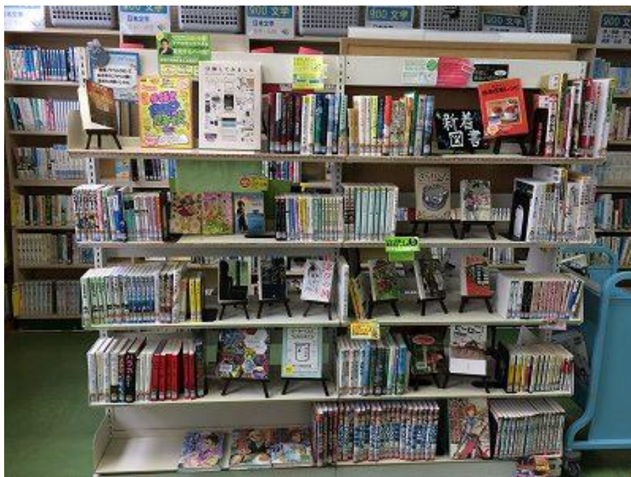
(大曲中学校 図書室)