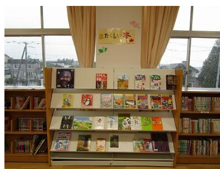
双葉小学校図書室 (新着図書コーナー)