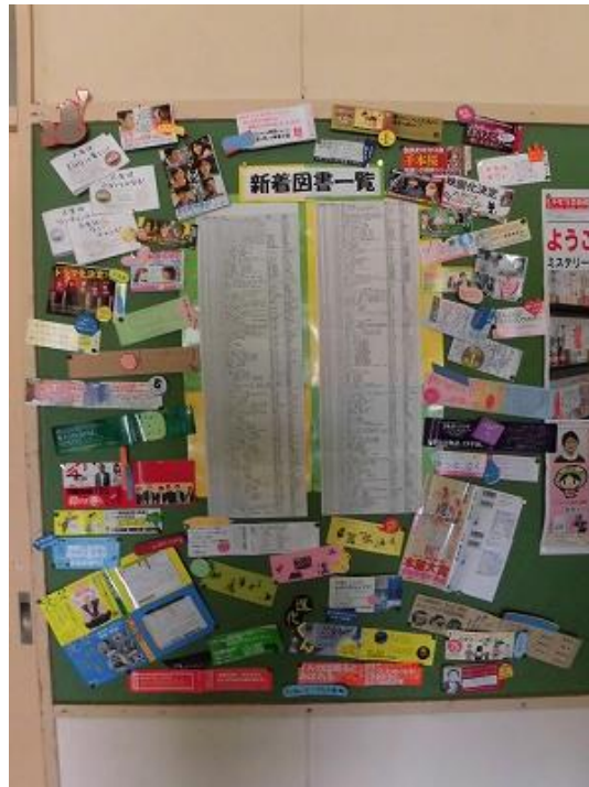
緑陽中学校図書室前掲示板 (新着図書紹介)