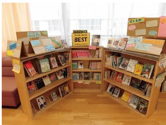
広葉中学校 特集「広葉中BEST」の様子