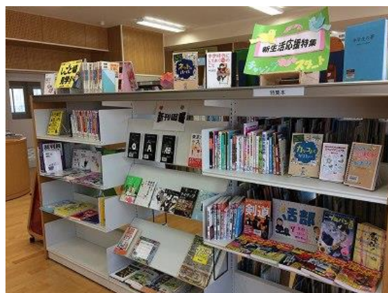
西の里中学校 特集「新生活応援」の様子