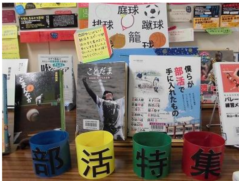
(西部中学校図書室前廊下 特集コーナーの様子)