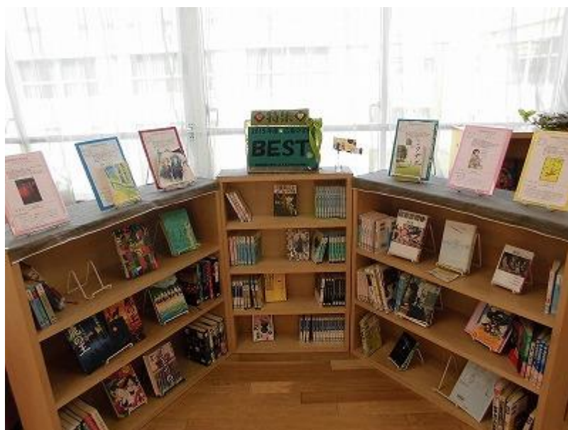
(広葉中学校図書室 特集コーナーの様子)