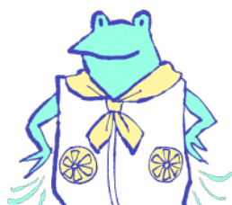
ファン付きウェア、 ネッククーラー