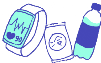
ウェアラブル端末、 応急セット