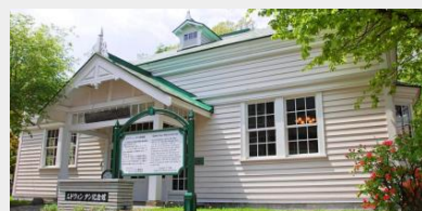
エドウィン・ダン記念館

◆ 参加申込/問い合わせ エコミュージアムセンター知新の駅 (011-373-0188)