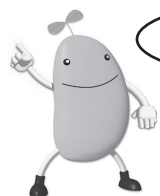
省エネキャラクター コマメちゃん