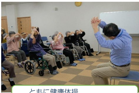
ともに健康体操 毎週（水・土）開催中です！