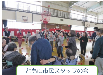
ともに市民スタッフの会 地域の運動会！