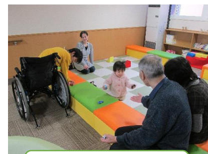
障がいの有無や世代を超えたつながり♪