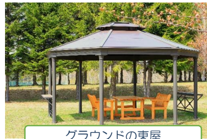
グラウンドの東屋