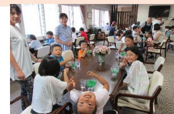
夏は親子で楽しく満席♪