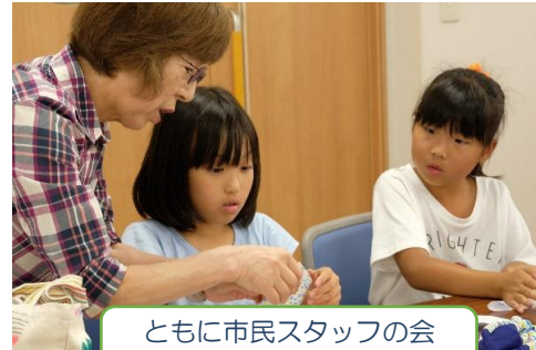
ともに市民スタッフの会 工作教室！