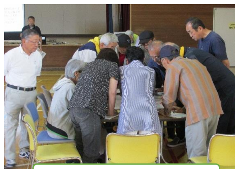
みんなで真剣に、DIG訓練！

・災害時の助け合いの仕組みをつくっている自治会があります。災害時要援護者を中心とした災害時の助け合いの仕組みは、普段の日常からお互いを気に掛けるつながりをつくることができます。日常の見守りにおいて、「監視されているみたいだ。」「個人情報保護の関係で難しい。」との声が多いなか、支え合いの仕組みづくりの糸口になるのではないのでしょうか。