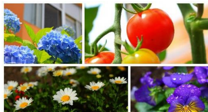
癒しのともにガーデンとトマト畑♪

・ともに人を喜んでもらえる場所にしようと、綺麗な花や、木の置物、繊細な切り絵などを、ともに市民スタッフや地域の方々飾ってくれています。ともにガーデンが初めての「花のまちコンクール」にて優秀賞をいただきました。