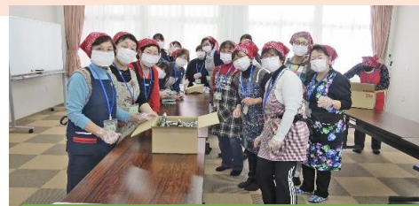
市民スタッフ、イベント準備中です！

・ともに市民スタッフの会が主体となって喫茶コーナーを運営しています。平成25年9月からスタートした週1回だった喫茶の営業は、現在週3回（月・水・金）の営業となりました。ともにで生活されている方々と地域の方々との交流が始まり、ともにの喫茶が地域における交流の場としての役割を担っております。