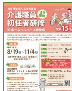
介護職員初任者研修