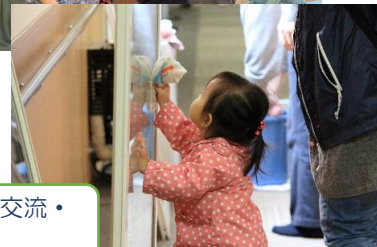
ともにメンバー会員の交流・ボランティア活動♪