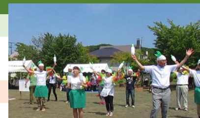
第4住区夏祭りでだいこんマンボ♪

・第4住区夏祭りへは毎年四恩園として参加させていただき、地域の方々と一緒に楽しませて頂いております。