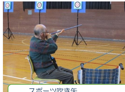
スポーツ吹き矢 呼吸法が健康の秘訣です♪