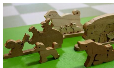
木の温もりが伝わってきます♪