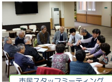
市民スタッフミーティング