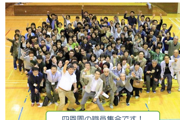
四恩園の職員集合です！