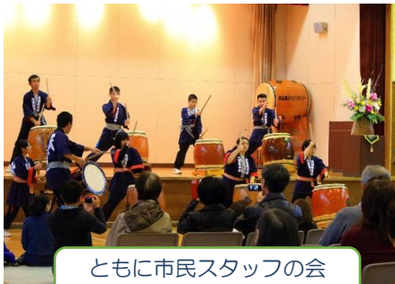
ともに市民スタッフの会 地域の学芸会！

・ともに市民スタッフの企画イベント（地域の学芸会、地域の運動会、工作教室）が開催されました。又、毎月1回「第4住区地域のお茶の間」と連携して、お茶会を中心に各種講座、コンサート、体操などを開催しています。地域の方々と、ともに生活している方々、北広島市・石狩振興局・北海道職員の方々、法人職員と一緒に盛り上がり世代を超えて三位一体で交流を図っています。