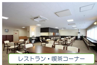
レストラン・喫茶コーナー