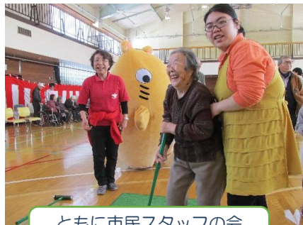
ともに市民スタッフの会 地域の運動会！