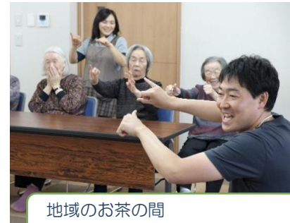
地域のお茶の間 みなみ支援センターの脳体操！