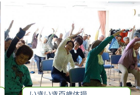
いきいき百歳体操 毎週（月・金）開催中です！