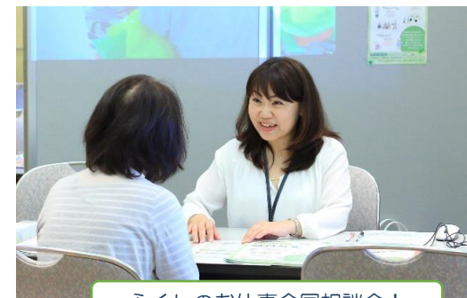
ふくしのお仕事合同相談会！