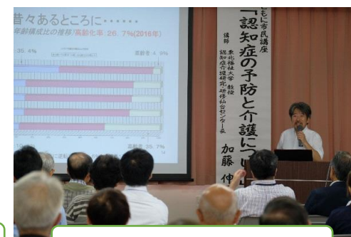
認知症予防についての市民講座