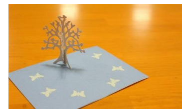
夏休み自由研究講座を開催♪