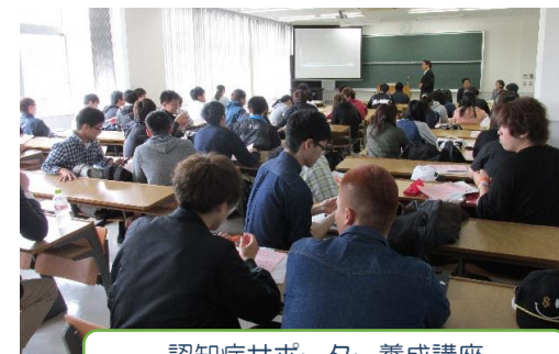
認知症サポーター養成講座 星槎道都大学の授業に参加！