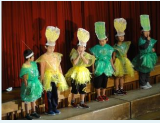
1年「はじめのあいさつ」