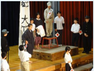
6年劇「はだしのゲン」