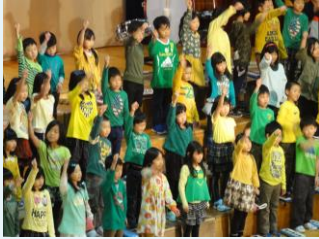
2年音楽「パワフル ～小さな力が大きな力へ～」