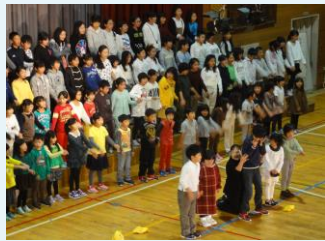
なかよし音楽「なかよし学級とゆかいな仲間たち」