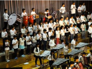
4年音楽「みんなの笑顔のために」