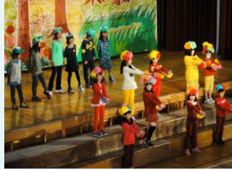
3年劇「忍者になりたかったカメレオン」