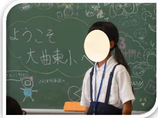
ようこそ〇〇さん(6年3組にて)