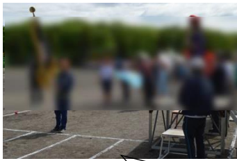
りりしかった入場行進