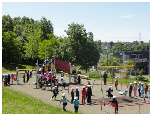
『遠足』6/16 遠足に行ってきました。当日の天候が心配されましたが、快晴と言ってもよいくらいの天気になりました。大きなけがもなく、楽しい一日を過ごしていました。