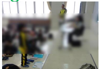
4年生『ひろば』6/8 視覚障がいについての話を講師の方からいただきました。「とても熱心にメモしていましたね。」とほめられました。