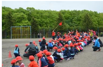
手に汗にぎった全学年『応援合戦II』