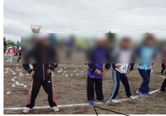
初めての運動会1年生『チェッコリ玉入れ』