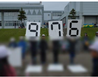
天気にも恵まれた最高の運動会ありがとう！！