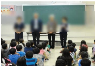
『人権教室』6/14,20 人権擁護委員の方々に、学年の成長段階に合わせて、人の権利の話や紙芝居やDVD等を使ってわかりやすく教えていただきました。