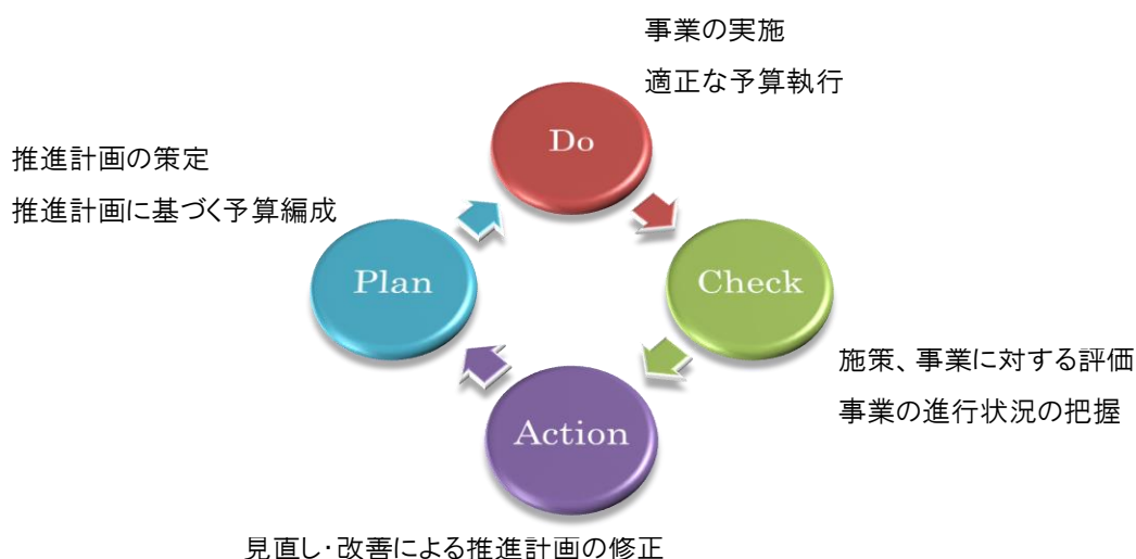
図-2 【PDCA(計画-実行-評価-改善)】の仕組

推進計画は、このマネジメントサイクルの中では、「P：計画」に該当するものです。具体的には、「D：実行」として当該年度の事務事業を実施しながら、前年度における事務事業の実施状況や当年度における事務事業の実施状況について「C：評価」を行い、目標を達成するために必要な「A：改善」を盛り込み、平成29年度から平成31年度までの「P：向こう3か年の事業計画」としてまとめたものです。